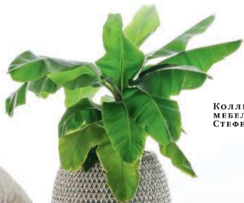
Коллекция садовой мебели DALA, дизайн Стефена Беркса, DEDON