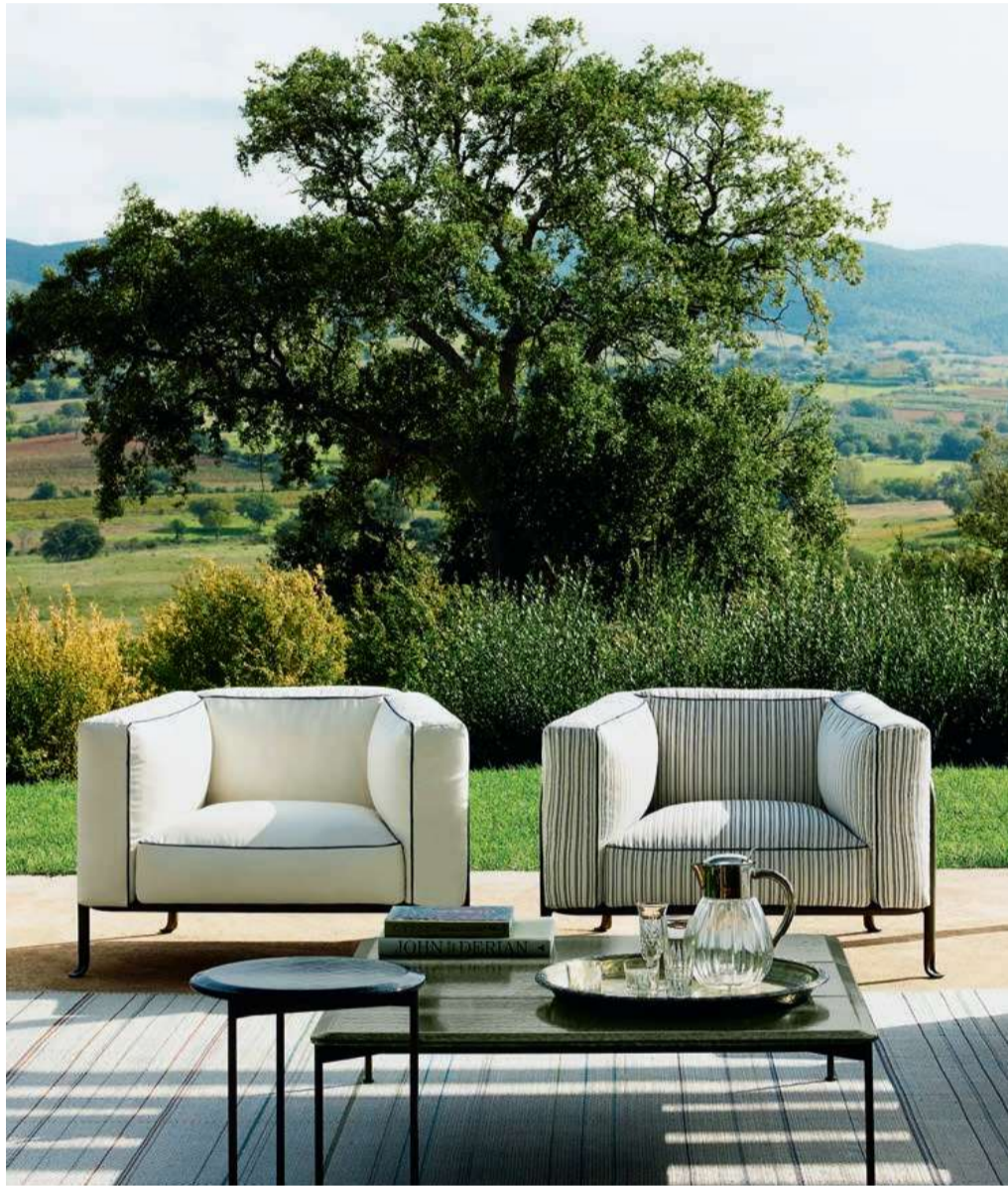
Кресло BOREA, дизайн Пьеро Лиссоли, B&B ITALIA