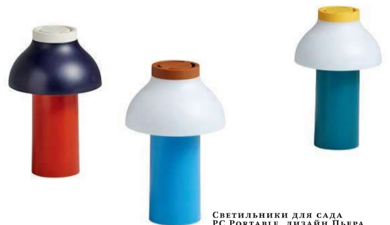
Светильники для сада PC PORTABLE, дизайн Пьера Шарпена, HAY