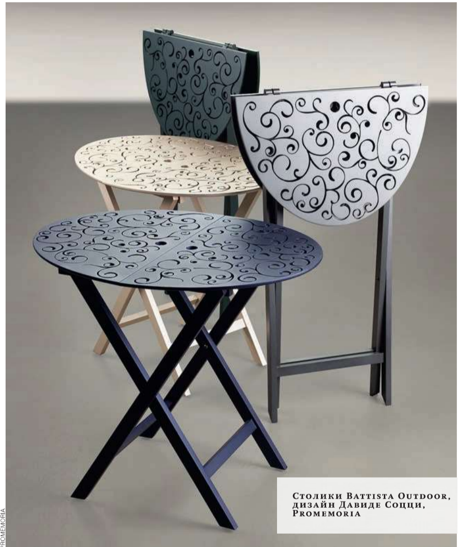
Столики BATTISTA OUTDOOR, дизайн Давиде Соцци, PROMEMORIA